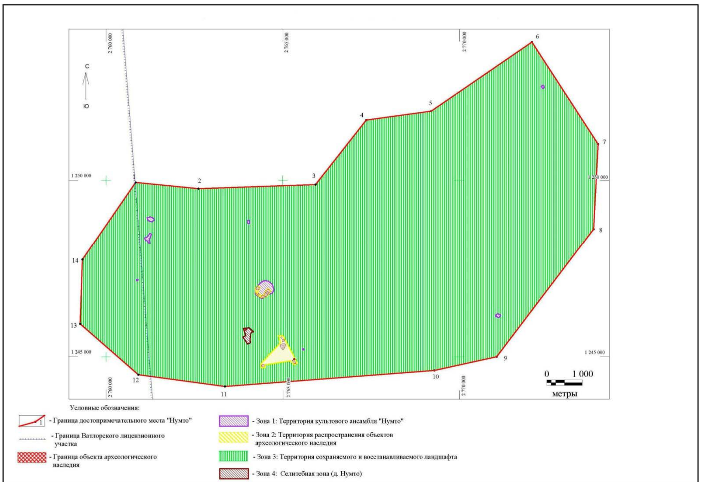
Схема границ территории объекта культурного наследия регионального значения достопримечательное место «Нумто»